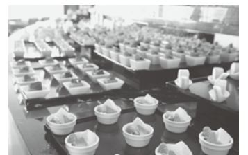
アフタヌーンティー バイキング