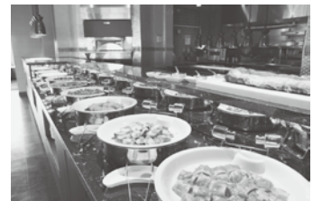
イタリアン バイキング