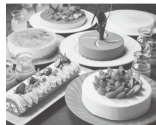
デザート（イメージ）