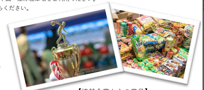
【協賛企業からの賞品】