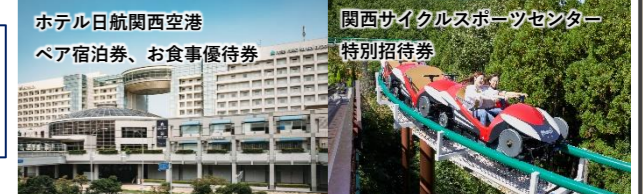
ホテル日航関西空港 ペア宿泊券、お食事優待券