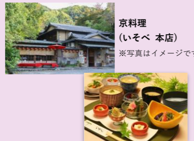
京料理 (いそべ 本店) ※写真はイメージです