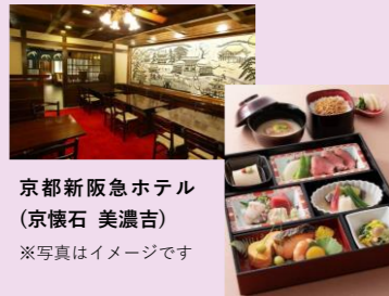
京都新阪急ホテル (京懐石 美濃吉) ※写真はイメージです

申込方法 事務局まで、申込フォーム・FAX・Eメールにて 事業所名・ 会員氏名・必要セット数 をお伝えください。