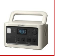
(Victor 家庭用バッテリー)