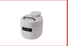
(シロカ おうちシェフ)